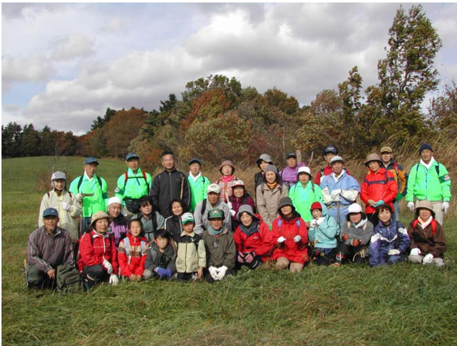
(畑前草地での記念撮影)