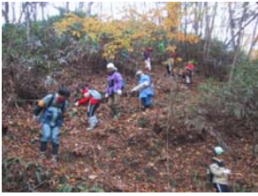
急斜面をロープ伝いに降りる