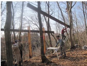
建設中のツリーハウス

のツリーハウスの紹介、つる細工や里山の素材を活かした工芸品の展示と販売、チェーンソーアートの展示・即売等を計画しています。ふるってご参加ください。